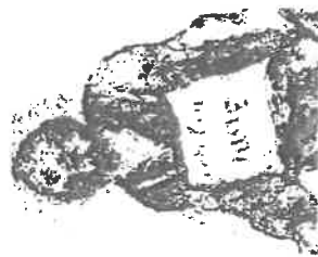
上(図72) マルク・シャガール 《白い磔刑》部分 下(図73) 同《白い磔刑》部分